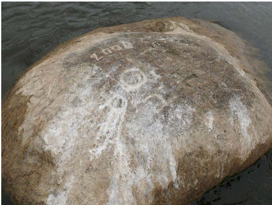
Hungerstein Schönebeck mit eingeschlagenen Daten (mit Inschrift 2008), 14.08.2008