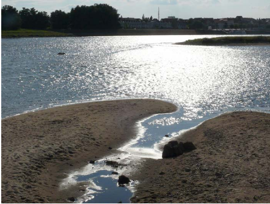
Blick von der rechten Elbseite über den Hungerstein hinweg nach Schönebeck, mit Bezug der Lage des Hungerstein zum Bühnenfeld, 08.08.2008, bei Stand des Elbepegels Schönbeck 90 cm