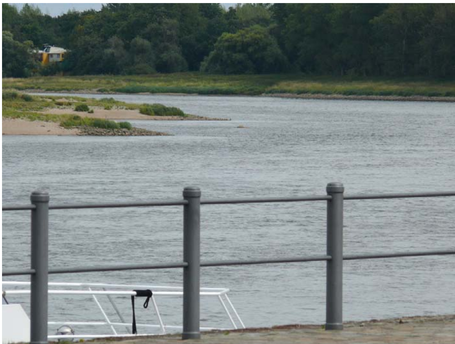
Blick vom Schönebecker Salzblumenplatz zum 620 m entfernten Hungerstein, bei einem Pegelstand von 98 cm (Elbepegel Schönebeck), 11.08.2008