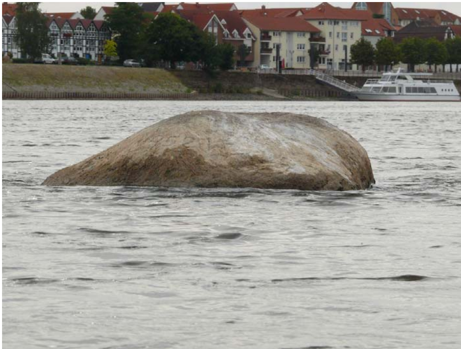
Blick von der rechten Elbseite über den Hungerstein hinweg nach Schönebeck, bei einem Pegelstand von 94 cm (Elbepegel Schönebeck), 14.08.2008